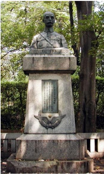
フォール大佐の胸像

明治44年に初の所沢飛行場が改札され大正8年にフォール大佐を団長としたフランス航空教育団が来日日本航空技術の飛躍的な発展に貢献しました。黎明期の所沢飛行場から終戦時までの所沢飛行場の歴史をたどります。