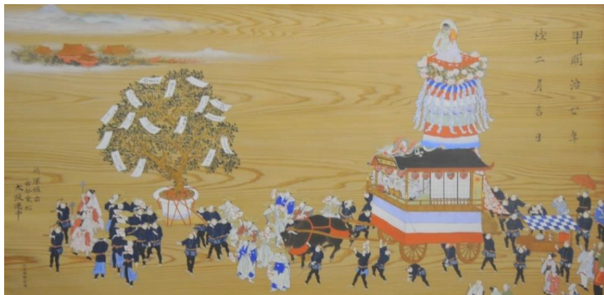
古谷重松太鼓連中奉納絵馬(明治7年入間市久保稻荷神社蔵)複製